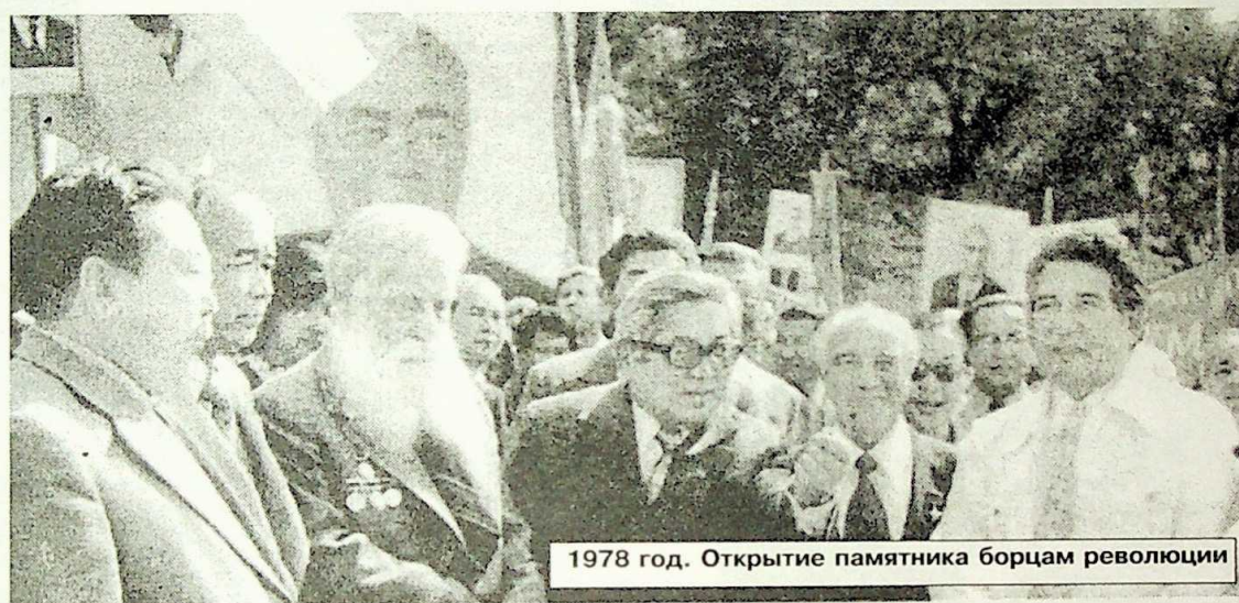
1978 год. Открытие памятника борцам революции

дальнейшая практика, эта мера позволила ЦК не только освободиться от посредников при выходе на творческие организации и деятелей искусства, но и обеспечить на основе обстоятельного анализа положения дел выработку более квалифицированных рекомендаций. При этом резко возросла оперативность рассмотрения назревших вопросов и значительно увеличилось их общее количество.